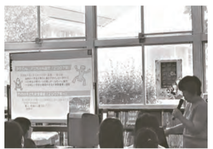
子どもたちは、熱心に聴いてくれました

し」もありましたが、意外と多かったのは「優しい人が多い」「見守ってくれる人がいる」「ふれあいまつりをはじめ、交流のイベントがある」というソフト面の住民のみなさんが、近所の子とも達にも、「いいところいっぱい」「おかえり」といったあいさつや声かけをされているのだというところがわかりました。小学校6年生に考えてもらった「竹の台の推し」、そしてこれから授業で取り組んで行く「自分たちが地域の中でできること」については、竹の台5カ年計画策定のための住民の意見聴取の一つとして取扱い、計画に反映した