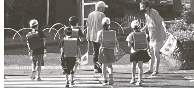
子どもたちの元気な声が聞こえてきます

また、これまで登下校の見守り活動に参加されていた方からは、「子どもたちのためにと考えていたが、参加してみると、自分が子どもたちか