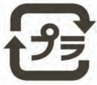
「プラゴミ」として出せるのは、このマークがついているものだけです

私達がクリーンステーションに出したごみは、ごみ収集車に収集される時点で目視によって適切に分別されているか確認され、不適切であれば収集されません。