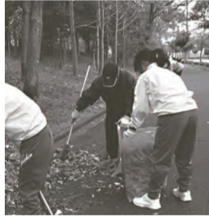
小・中学生と一緒にクリーン作戦

さらに、災害時など、イザというときには、中学生や高校生が、あなたを助けることのできる存在にもなります。地域の子どもたちとともにできる活動や学校支援活動を以下に紹介いたします。