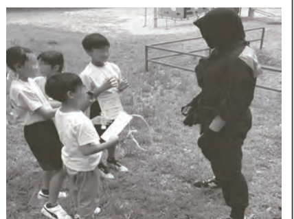
子どもたちの一番人気、忍者登場!

中でもいちばん反響があったのは、忍者を見つけたら試練を言い渡されまます。それをクリアしたらスタンプラケット! ゴールでは宝探しで見つけた宝トルをそれぞれの景品に替えて終了。お天気も回復してきたので、景品の竹とんぼ等でもいっまでも遊んでいました。