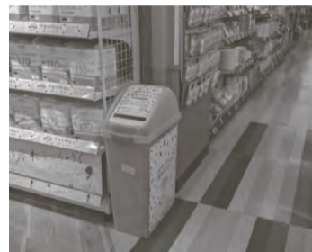
イオンフードスタイル西神中央店では、キッチンペーパー売場の棚横に回収ボックスが設置されています。