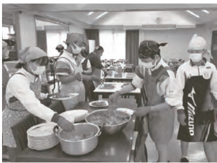
バンブークラブでは、40人分の配食に奮闘

7日は、バンブークラブ(高齢者食事会)のお手伝いや参加者との交流、午後は小学校の見守り活動を行いました。9日は、竹の台小学校、西神中学校の備蓄倉庫点検と大