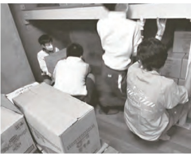
西神中備蓄倉庫では、備蓄用品の整理

日頃から住民同士が顔見知りの関係を作っておくことが大事だと意見が一致しました。ワークショップを通じ、竹の台地域委員会のまちづくりの活動が、SDGsの目標と一致するところが多くあることに、みんなで気づくことができました。