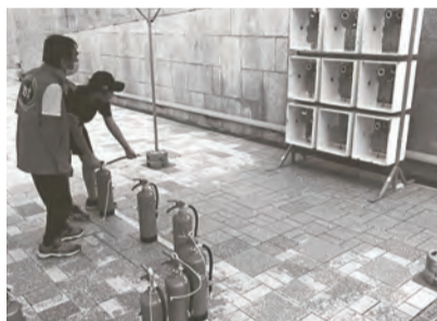
水消火器的当て。うまく当たったかな!

竹の台が担当したのは、NPO法人プラス・アーツが運営する「イザ!カエルキャラバン」中の「水消火器で的当てゲーム」。このコーナーでは、「水消火器的当てゲーム」の他、「ジャッキアップゲーム」「毛布担架でタイムトライアル」「BOSAI工作室」「防災