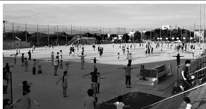
来年度も、たくさんの方の参加をお待ちしています。夏でも、早朝は気持ちよいですね

夏休みが始まってすぐ、恒例のラジオ体操が7月22日から8月1日までの間、開催されました。晴天に恵まれ、11日間すべて開催となり、2,522人(子ども1,699人、大人823人)の参加がありました。