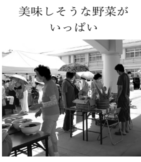
美味しそうな野菜がいっぱい

7月末、竹の台小学校のうさぎ小屋に、玉津第一小学校よりうさぎが一羽やってきました。名前は「ミルク」。メスで生後1歳1か月になります。 夏休みの学校が閉校している間、毎日交代で、地域の方がエサやりをしています。人なつこくて、かわいいとの話し。元気いっぱい、小屋の中をびよんびよん飛び回っています。 もう1羽の鳥小屋にいる白いうさぎ「ユキ」ちゃんとともに、可愛がってあげてください。