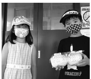
大きな、おいしそうなおももよかったですね!

や手作りアクセサリ、オリジナル陶器、フリーマーケット等販売する方々も久しぶりの出店で楽しそうでした。 会場には、小さな子どもさんを連れたご家族もたくさん来場され、小学生の子どもたちにも、青少協が運営する輪投げコーナーが人気でした。また、参加した方すべてに賞品があたるという福引コーナーを設けました。1等、2等は押部谷産の「もも」。当たったご家族のうれしそうな顔が印象的でした。