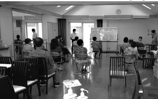
今回は感染対策のため、2名/団体の参加とさせていただきます。活発な意見交換が行われ有意義な会となりました。

住宅の形態により、同じ丁目でも、課題が異なるということになります。ご自分が住んでいるエリアがどこに属しているか把握しておきましょう。