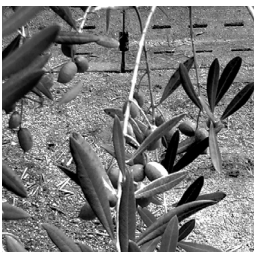
たくさんの実がついた竹の台小のオリーブ

オリーブがたくさんの実をつけており、収穫が楽しみです。それに比べ、北公園、西公園のオリーブの成長が悪く、今年も実をつけるほどの成長は見られませんでした。園芸に詳しい方、「こうすればいいよ。」等のアドバイスをいただければと思います。竹の台地域福祉センターまで、ご一報をお願いします。 また、毎月第1土曜日に中学校のオリーブの清掃を行う