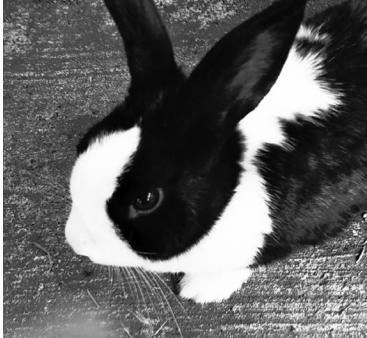
はじめてまして、「ミルク」です。よろしく!