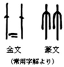
金文 篆文 (常用字解より)

この1年半ほど漢字の成り立ちや、中国語を表現するための文字(漢字)を先人たちが日本語としてどの様に取り込んできたのかなど、グループで調査したり学習する機会があった。 漢字は三千数百年の間消滅することなく、世界でも類を見ない悠久の歴史をもつ文字であり、漢字一文字ごとにその物語を内包しており、その奥深さに魅了されている今日この頃である。 それで、漢字「竹」の成り立ちについて調べてみた。漢字の分類には6通りがあり、その中で「竹」は象形であり、竹の葉が垂れている形を表している。下図は「竹」の古代文字で、その後数千年かけて現代文字へと変化していく。 漢字の最も古い証は紀元前1300年頃の甲骨文字や金文であるが、その文字体系は既に高度なもので、おそらくそれ以前の発展の歴史があるはずであり、今後の証しが偶然発見されれば漢字の歴史は大きく変わり、その起源はエジプト古代文字ヒエログリフの起源(紀元前3000年頃)などと同肩を並べるのではないかと想像するのもおもしろい。 現代、読めるけど書けない漢字をスマホやパソコンで簡単に入力でき、手で書く機会が少なくなってきたという実情を考えると、小学校や中学校での漢字教育は今まで以上に大切になってくると感じる。